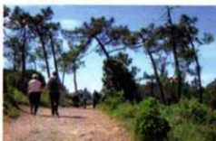
Photos : La Villa Saint Camille et participants.