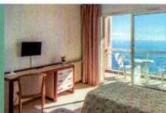
Chambres et terrasses s'ouvrent sur la mer.

Venez savourer des moments de bien-être, de relaxation et d'échanges, pour vous ressourcer et vous retrouver.